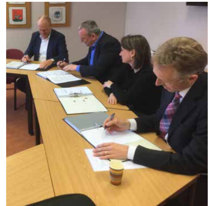
Ondertekenaars namens de gemeente Waterland, BPD Ontwikkeling BV, Hoorne Vastgoed Ontwikkeling BV en de Projectontwikkeling Galgeriet BV