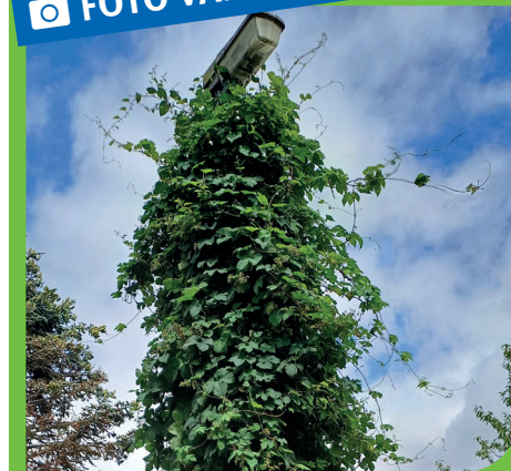
De hop neemt deze lantaarnpaal in Monnickendam helemaal over.

Heeft u ook een mooie foto die wij op deze pagina mogen plaatsen? Stuur uw foto dan naar communicatie@waterland.nl of tag de gemeente Waterland op sociale media: @gemwaterland .