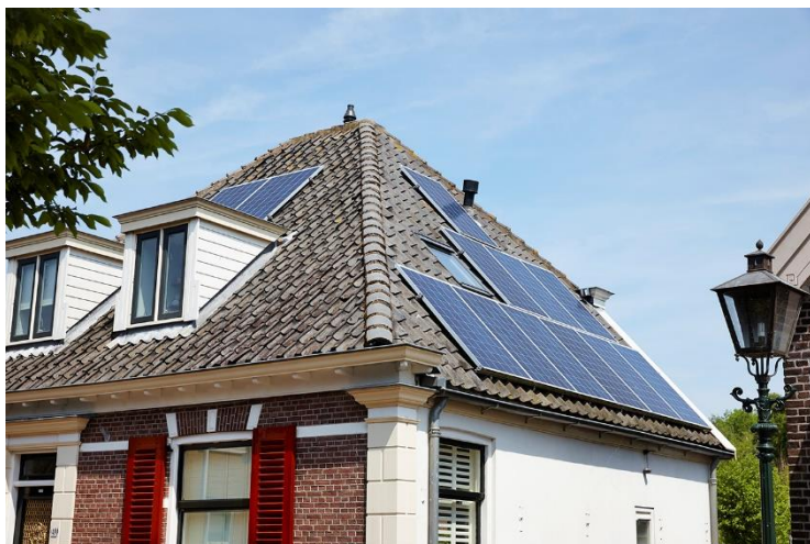
Zonnepanelen op een monument

Daarnaast heeft de gemeente Waterland met haar vele beschermd gezichten grote stappen gemaakt op het gebied van het verduurzamen van erfgoed. Door middel van VNG gelden uit de innovatieve aanpak heeft de gemeente diverse bewoners van huizen met een monumentale status dan wel ligging in een beschermd gezicht geadviseerd over verduurzaming. In 2018-2019 zijn inloopavonden georganiseerd (36 bezoekers) en adviezen op maat/warmtescans (12 stuks) uitgevoerd op het gebied van de verduurzaming van deze monumentale/woningen in beschermd gezicht. Voorbeelden daarvan zijn de Rietveldwoning in IJpendam en het Broekerhuis. De kennis die daarbij wordt opgedaan wordt dan ook met veel aandacht gevolgd door andere gemeenten met veel erfgoed zoals kenbaar werd bij het mede door de gemeente Waterland georganiseerd Duurzaam erfgoed congres 'back to the future' in 2018 en 'Van gouden eeuw naar groene eeuw' in de Amsterdamse markthallen in 2019.